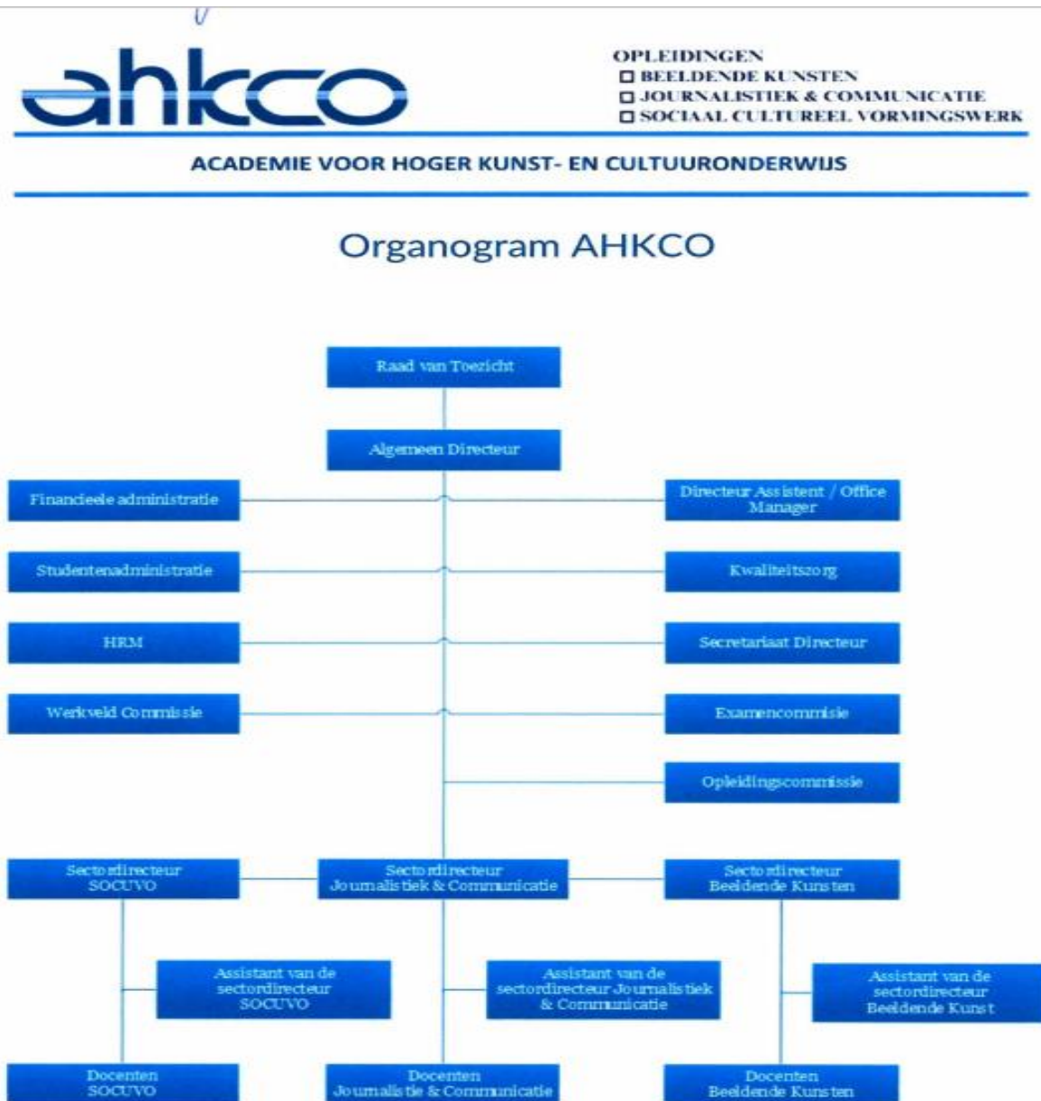
Figuur 1: Huidige organisatiestructuur AHKCO

In figuur 1 is de huidige organisatiestructuur weergegeven.