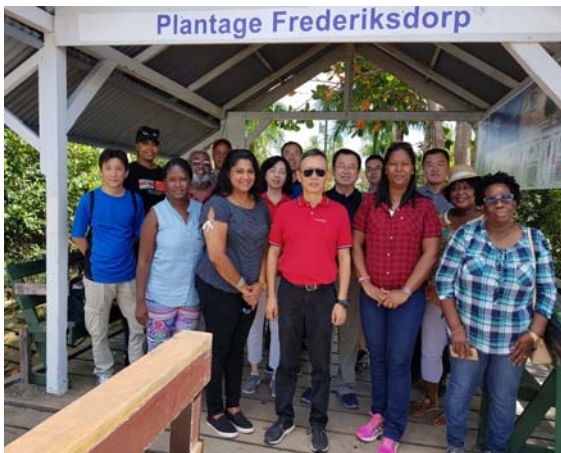
Delegatie CNAO en de Kamer