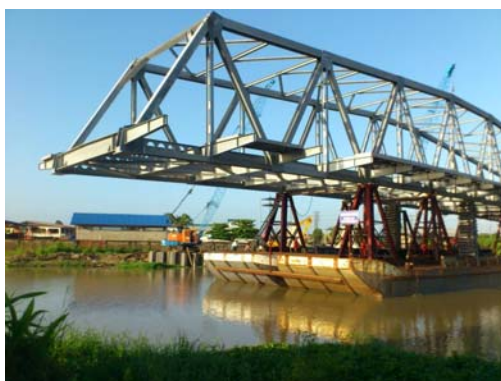
Nieuwe brug over het Saramaccakanaal

Om onze doelstellingen te bereiken zijn de nodige documenten opgevraagd en geanalyseerd tegen de materialiteit van de contracten. Tevens is er een risico-evaluatie gedaan om een goed begrip te verkrijgen van de planning, inkoop en het contractmanagement van de aanbestedingspraktijken van het ministerie. Verder zijn er gesprekken gevoerd met de verschillende functionarissen van het ministerie.