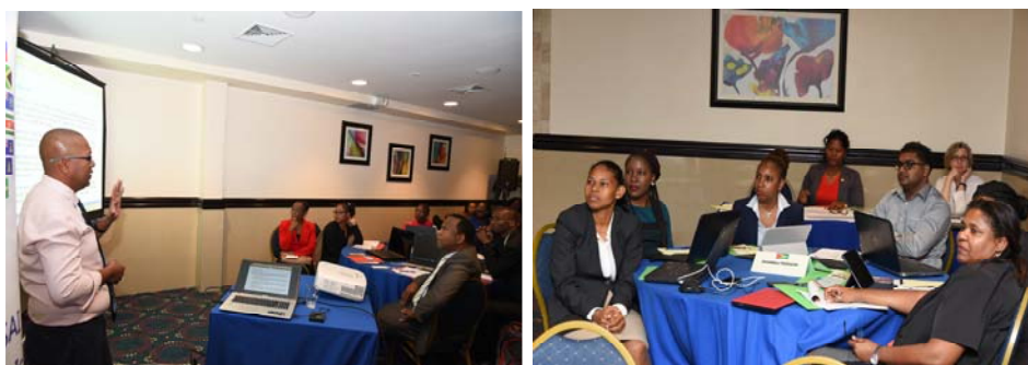
Facilitator en participanten van de Report Writingworkshop in Jamaica

In oktober 2018 is het onderzoek volledig afgerond en de bevindingen en aanbevelingen zijn daarna ook aangeboden aan het parlement.