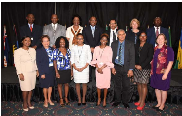
Voorzitters van rekenkamers en delegatieleden van CAROSAI tijdens de conferentie 30 jaar herdenking CAROSAI in Jamaica

De follow-up van betreffende conferentie is om in CAROSAI-verband activiteiten te organiseren ter versterking van de bewustwording of capaciteit in voornoemde gebieden.