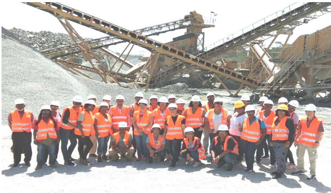
Medewerkers Kamer op bezoek bij Grassalco- rondleiding Royal Hill