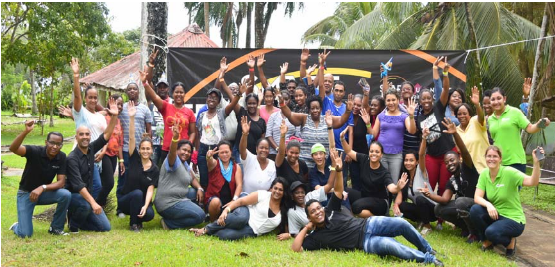
Teambuildingsdag 4 mei 2018

Kamer. Op een ontspannen wijze is door SMART Suriname spelen aan elkaar gekoppeld die in groepsverband tijdens de teambuildingsdag zijn uitgevoerd.