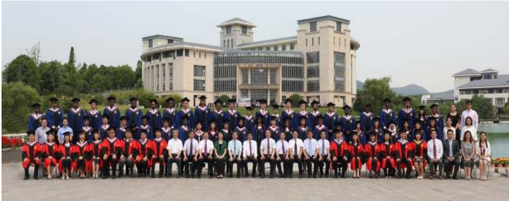
Eerste groep afgestudeerden van de Master in Auditing Programme

Voor de auditor was het een hele eer te mogen deelnemen aan een studie die haar kennis in auditing heeft verruimd en bovenal om de Kamer te mogen vertegenwoordigen. Hierdoor kan zij met de opgedane kennis en inzichten met betrekking tot het internationaal auditgebeuren bijdragen aan haar professionele ontwikkeling en het versterken van de Kamer.