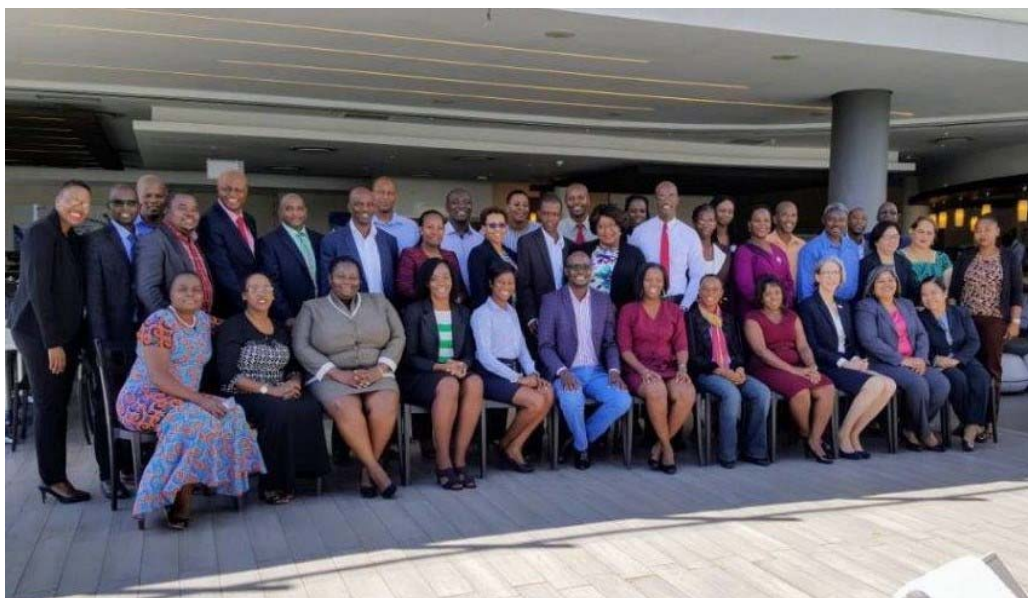
Facilitators en participanten van de IDI Capacity Development Programme on SAIs Engaging with Stakeholder in Zuid-Afrika

De training was een follow-up van de in 2017 gehouden training met als thema Stakeholder Engagement Strategic Plan in Johannesburg, Zuid-Afrika.