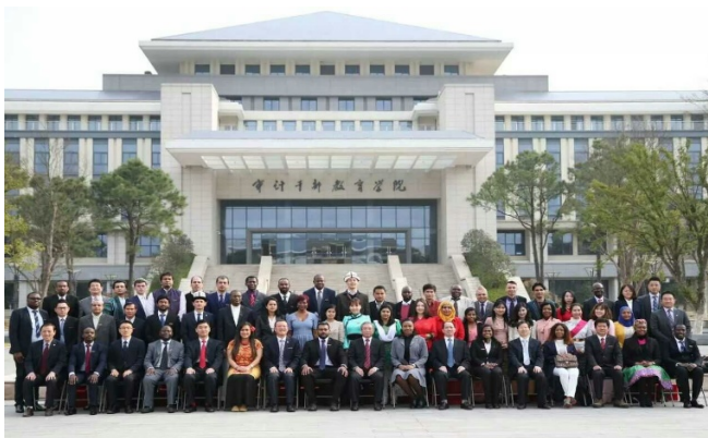
Welcome meeting met de voormalige Auditor General van de CNAO, de heer dr. Liu Jiayi

Op 4 juni 2018 heeft zij haar onderzoek met als titel “Comparative study of Financial Audit on the Central Bank using ISSAIs” succesvol kunnen verdedigen. Zij verkreeg daardoor de graad van Master of Auditing (MAud).