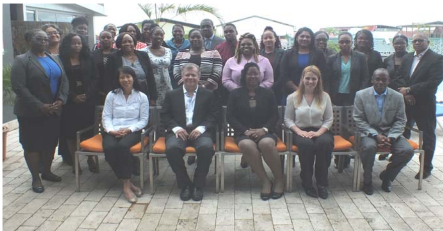
Facilitators en participanten van de SAI PMF-training in Suriname

De Kamer heeft in oktober 2016 onder leiding van twee (2) externe deskundigen een SAI PMF-assessment verricht. De resultaten van het onderzoek zijn in januari 2017 gepresenteerd aan de Kamer en hebben als input gediend bij de formulering van het strategisch en actieplan 2017 - 2021. Met deze training hoopt de Kamer dat met de technische bijstand die geboden is, de impact van het werk van de participerende rekenkamers verbeterd wordt.