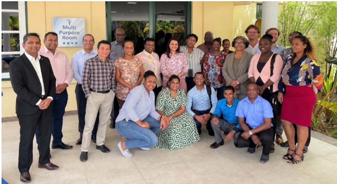
DDO-team samen met college leden en management bij de presentatie van projectvoorstellen

Elke workshop is door de trainers ingeleid met een korte presentatie over relevante theorie en ervaringen.