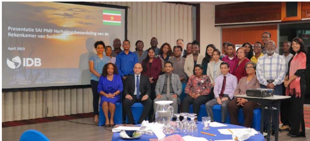
Fotomoment: Presentatie van SAI-PMF resultaten

Op dinsdag 25 april 2023 had de consultant een aparte werksessie met het managementteam van de Rekenkamer. Hierbij is zeer gedetailleerd gekeken naar de resultaten en er werd onder andere uitgelegd welke methodologie was gevolgd. Het actieplan dat aan de hand van de resultaten is geformuleerd, is ook gepresenteerd door de consultant. Op de laatste dag is er ook een presentatie gehouden, en wel specifiek voor de overige strategische stakeholders van de Rekenkamer. Onder andere waren aanwezig een vertegenwoordiger van DNA, de directeur van de CLAD en vertegenwoordigers van de IDB. Vervolgens is het rapport van deze IMF-assessment gedeeld met de volgende actoren, namelijk: IDB, CAROSAI, INTOSAI, IDI en het Rekenkamer personeel.