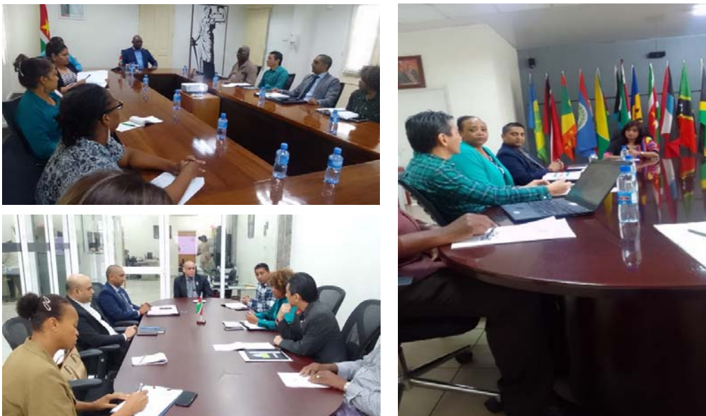
Fotocollage Stakeholders Engagement Strategy

De kick-off heeft plaatsgevonden op 24 november 2023 op het Ministerie van Volksgezondheid en tot eind 2023 waren reeds veertien (14) ministeries bezocht. De delegatie van de Rekenkamer bestaat over het algemeen uit de voorzitter, de secretaris, de directie van het Bureau en een adjunct-secretaris, aangevuld met 1 collegelid. Uit de reacties is ook gebleken dat de presentatie en de sessies effectief en verhelderend zijn bevonden door de ministeries.