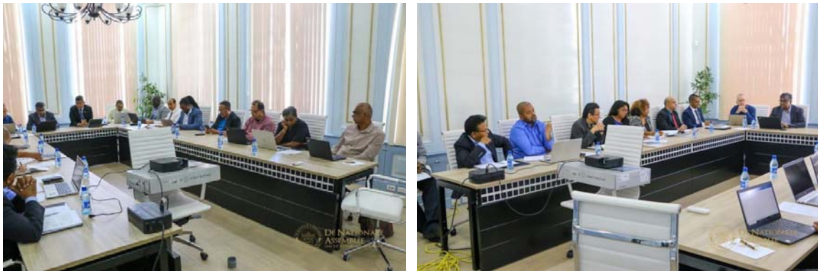
Fotomoment: overleg vaste Commissie Staatsuitgaven van DNA, de Rekenkamer, CLAD en MinFin

Op maandag 21 augustus 2023 is het overleg met de vaste Commissie Staatsuitgaven van DNA, de Rekenkamer, CLAD en MinFin gecontinueerd. Deze gesprekken hadden onder andere betrekking op het vaststellen van het Slot der Rekeningen over de dienstjaren 2020 en 2021. Uiteindelijk zal er een overgangswet geïnitieerd worden ter behandeling in DNA.